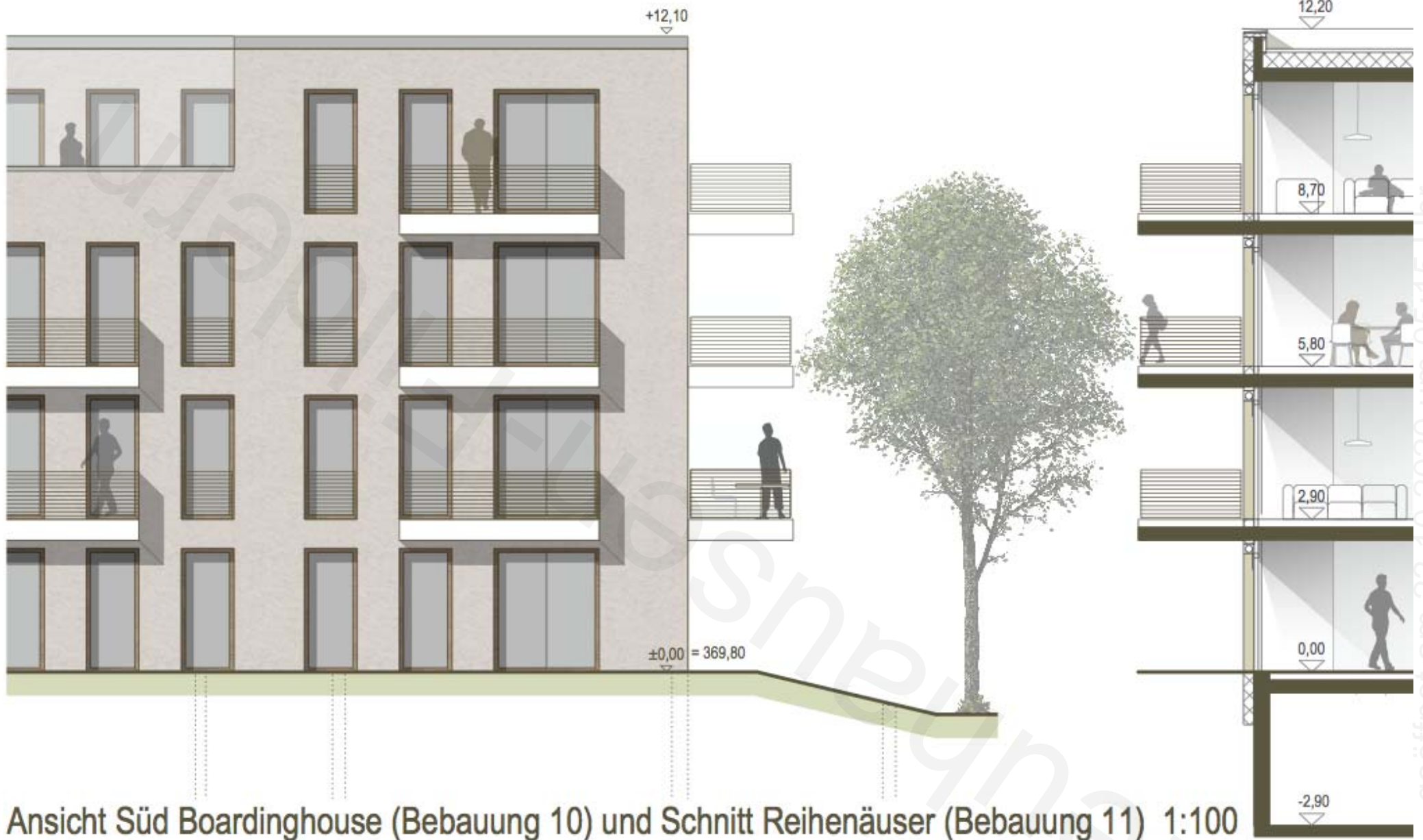
Ansicht Süd Boardinghouse (Bebauung 10) und Schnitt Reihenäuser (Bebauung 11) 1:100